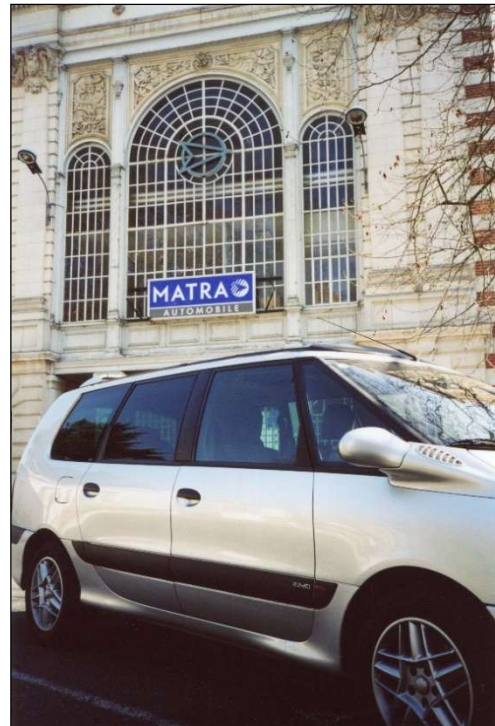
Espace 3 ème génération devant l'entrée du personnel du site industriel « Romo 1 », rue Normant

A l'appui d'une série de plans des différents sites de production, des années 1960 aux années 2000, nous évoquerons une partie de l'histoire de l'entreprise MATRA Automobile et parcourrons ses différents ateliers pour susciter de nouveaux témoignages et écrire, ensemble, un pan de notre histoire industrielle et ouvrière contemporaine.