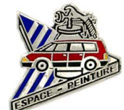
Objets (pin's, découpe d'une trappe à essence) aux couleurs des sites de production de MATRA Automobile à Romorantin-Lanthenay