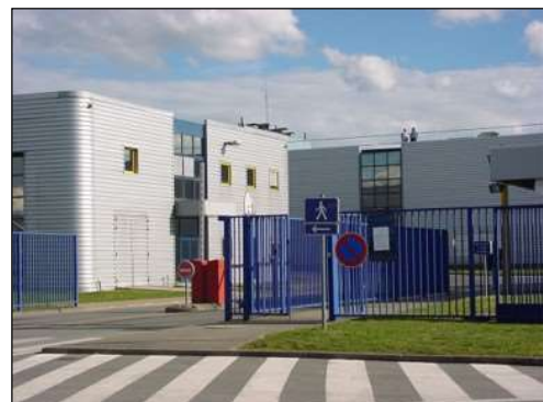
Entrée du site industriel « Romo 3 », rue de Plaisance